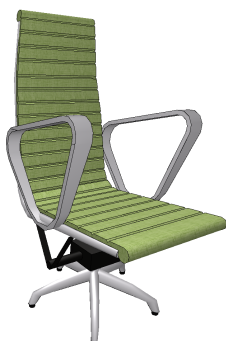
vizualizace kancelářské židle